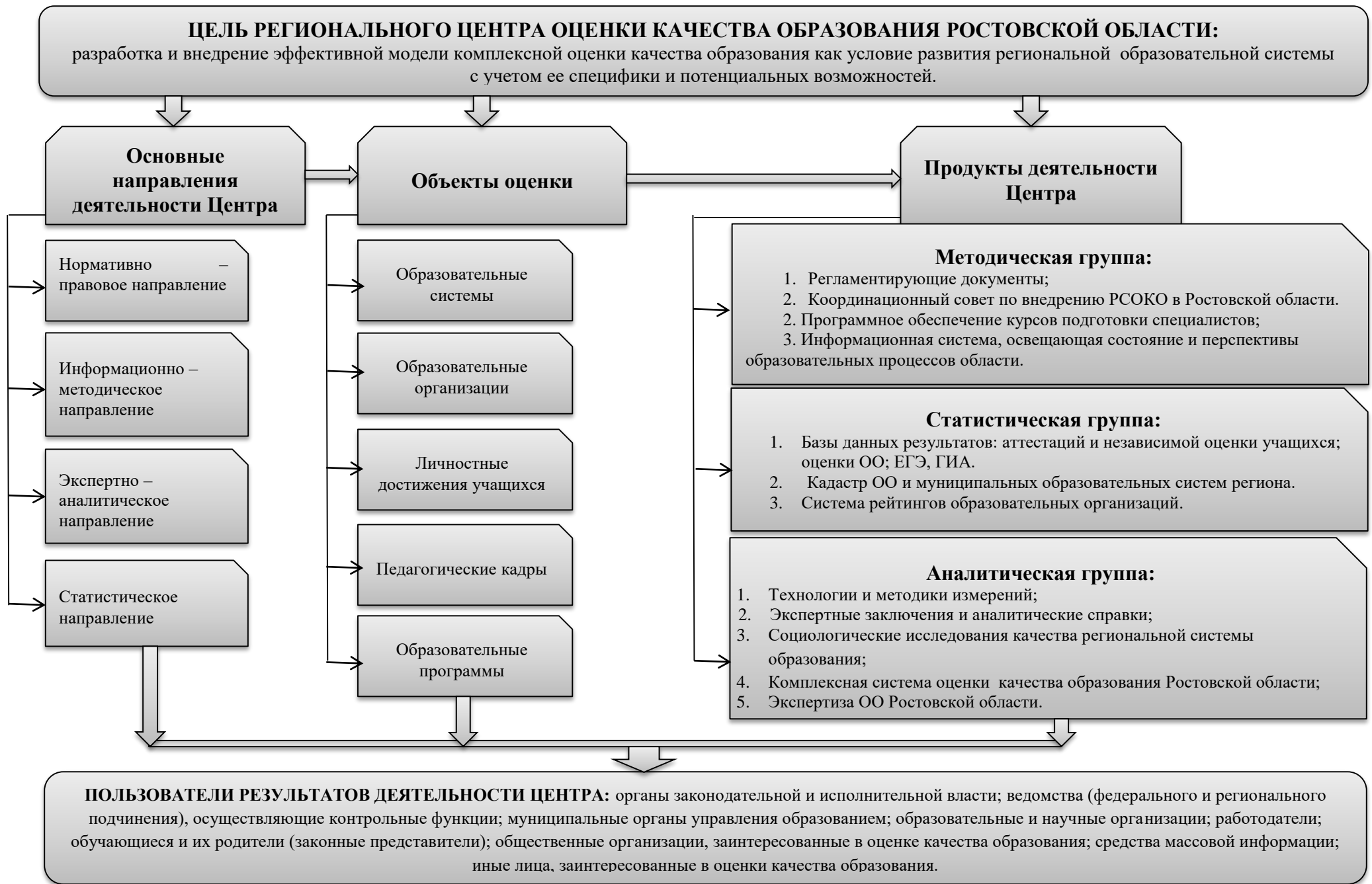
Рисунок 2. Модель деятельности регионального Центра оценки качества образования Ростовской области